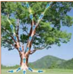
Das Kapillarsystem des Baumes

Von Natur aus besitzt Holz das Bestreben, Wasser zu leiten. Für Bäume ist das Kapillarsystem, das aus Myriaden mikrofeiner Poren und Kanäle besteht, lebensnotwendig.